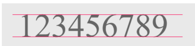
Normalziffern als Beispiel